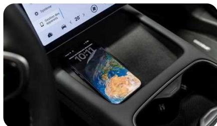
Chargeur rapide sans fil 50W ventilé