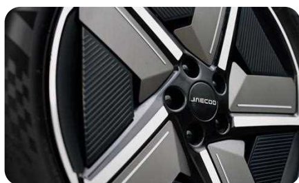
Jantes alliage 19"