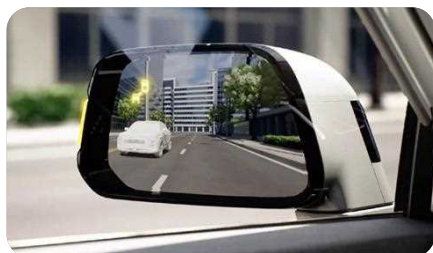
Détection des angles morts (BSD)