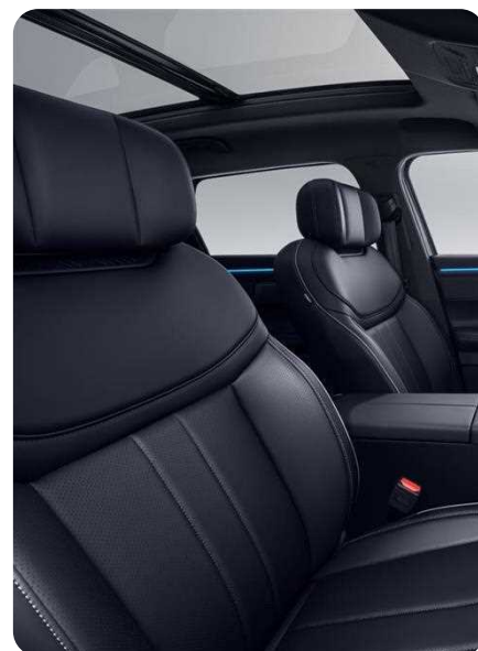
Sièges avant chauffants et ventilés