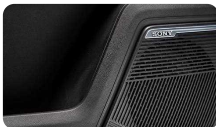
Système audio SONY à 8 haut-parleurs