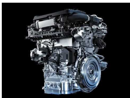
Moteur de 5 ème generation DHE (Dedicated Hybrid Engine)