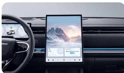
Écran central 14,8"