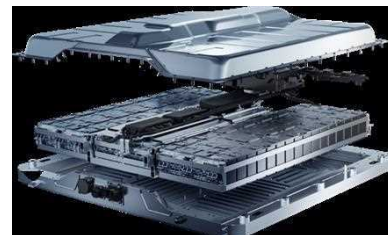
Pack batterie DHB (Dedicated Hybrid Battery)