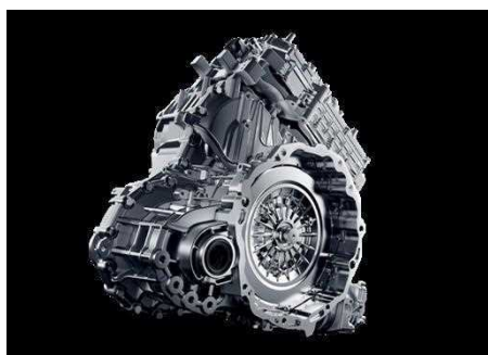
Transmission 1DHT (Dedicated Hybrid Transmission)