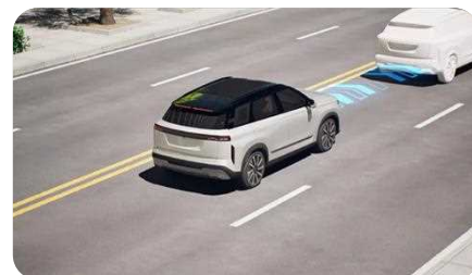
Régulateur de vitesse adaptatif (ACC)