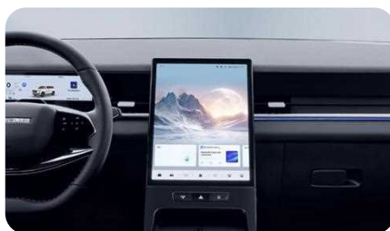
Écran central 13,2"