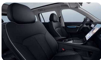
Sièges avant chauffants et ventilés