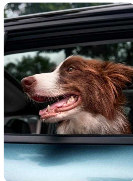
Sièges anti-odeurs et résistants aux griffures