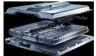
Pack batterie DHB (Dedicated Hybrid Battery)