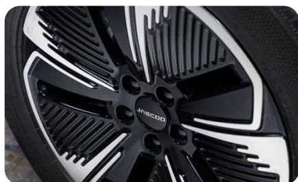
Jantes alliage 18"