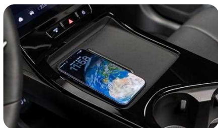
Chargeur rapide sans fil 50W ventilé