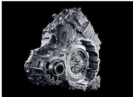
Transmission 1DHT (Dedicated Hybrid Transmission)