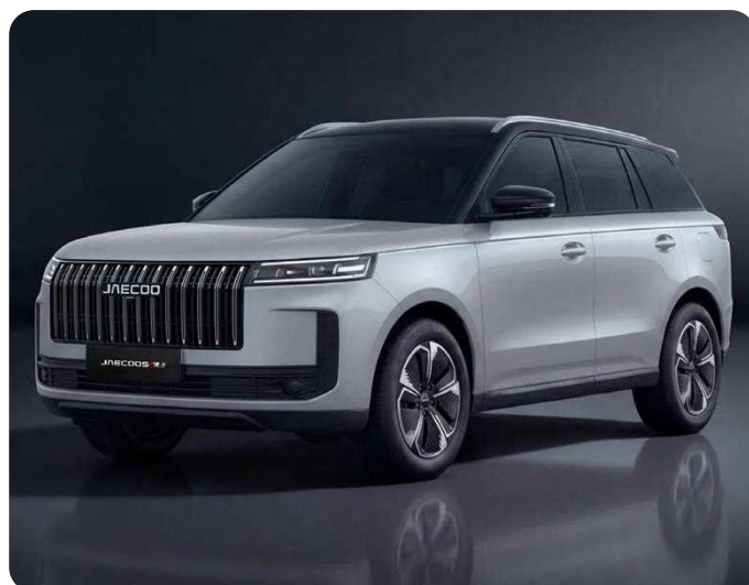
Blanc Khaki + Toit Noir**