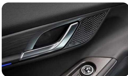
Système audio SONY à 8 haut-parleurs